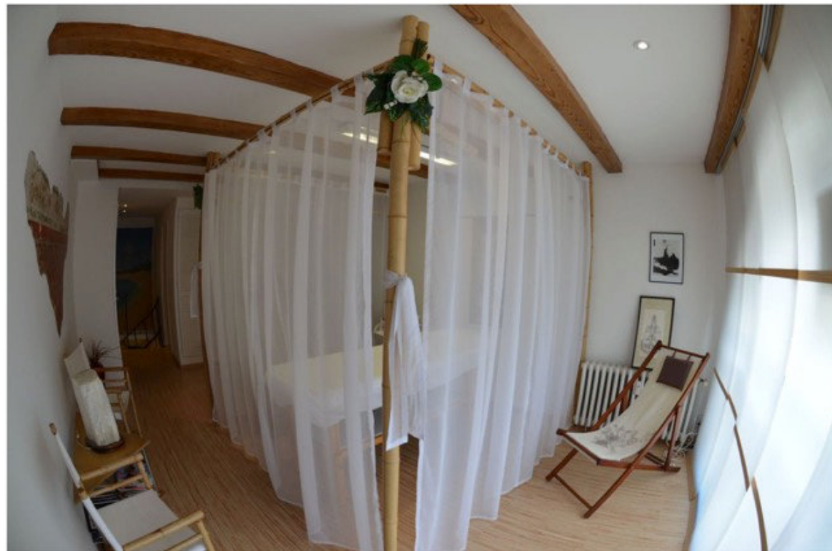
Zuckerhut Brazilan Waxing &amp; Brasilianische Bademode

Denn in ihrem Geschäft in der Hamburger City, „Zuckerhut Brazilan Waxing & Brasilianische Bademode“, unter zuckerhut-waxing.com zu erreichen, findet man nicht nur modische Akzente aus Brasilien, sondern auch Trends, die für mehr Beauty sorgen.