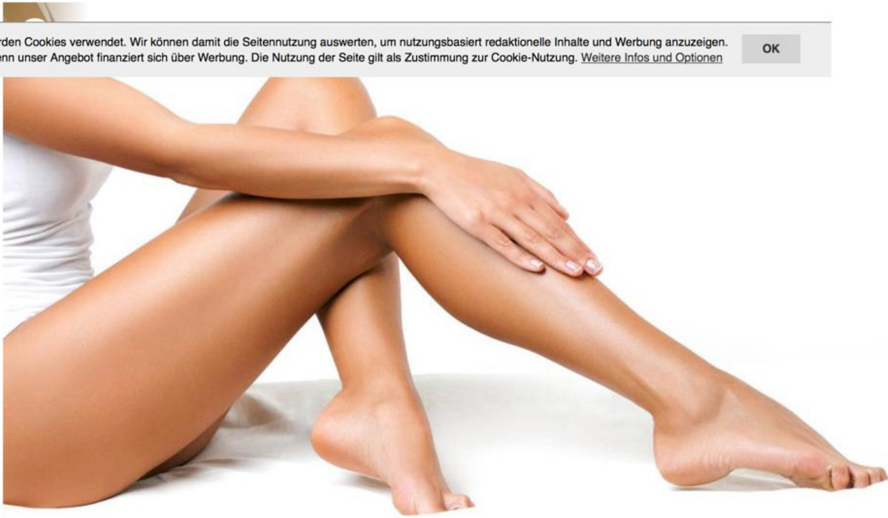
Ist Nutriwachs das Geheimnis glatter Beine?

Klopf, Klopf: Der Frühling steht vor der Tür! GALA-Volontärin Ronja möchte Bein zeigen und testet dafür den Nutri-Wachs, der eine Betäubung der Haut und ein damit fast schmerzfreies Waxing verspricht