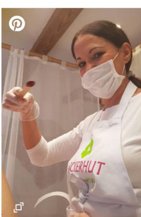
Nutri-Wachs besteht auf einer Schoko-Öl-Basis.

Mit einer schnellen, flachen Bewegung reißt sie das Tuch ab. Erleichtert stelle ich fest, dass es tatsächlich schmerzfreier als sonst ist und atme beruhigt aus.